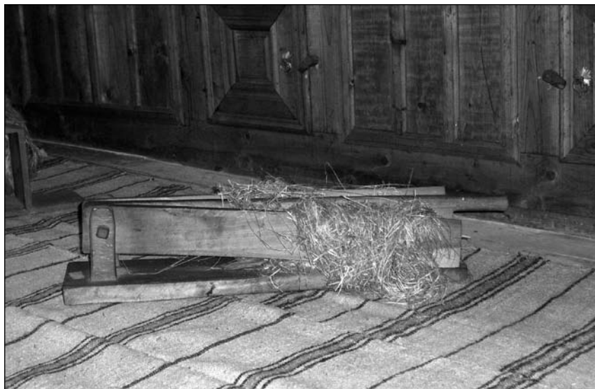
Снимка 6. Мелица (мельца)