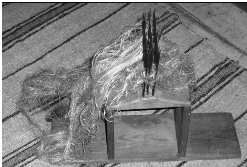
Снимка 7. Прав дарак