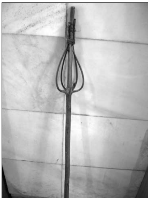
Снимка 5. Хурка „къжел”