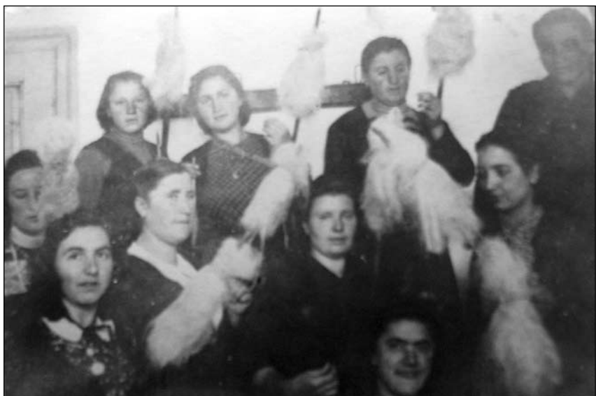
Снимка 3. Седянка за предене на лен в Батак, 1946 г.