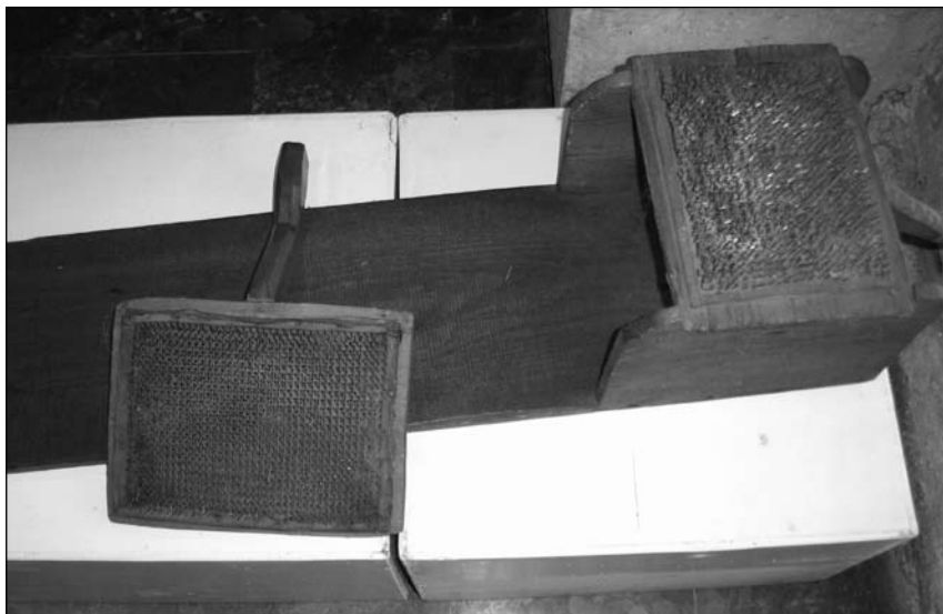
Снимка 4. Крив дарак