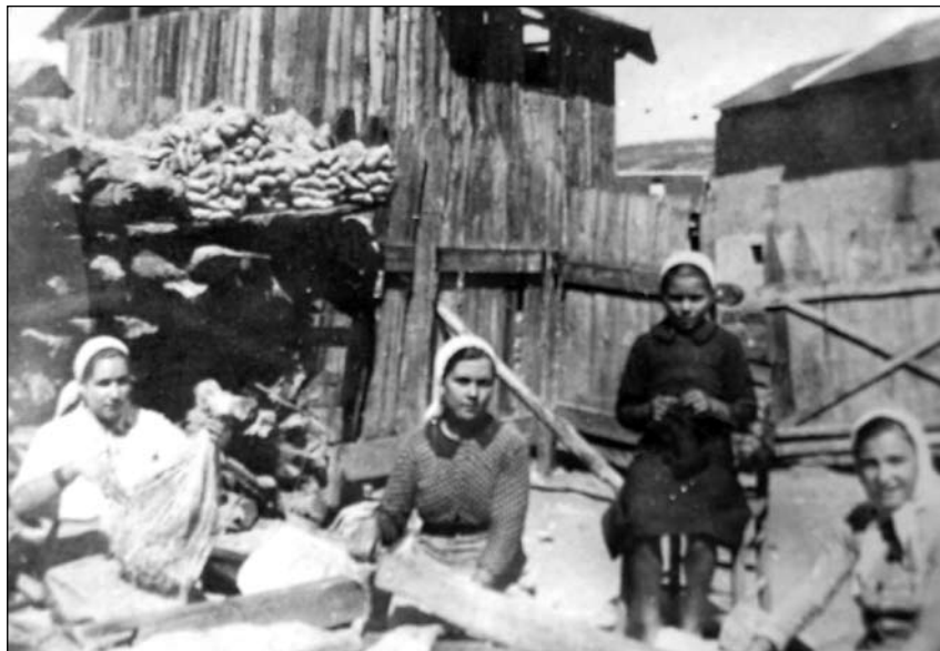
Снимка 1. Мънене на лен в Батак, 1940 г.

12 Арnaudов, Ал. Пос. съч., стр. 147–148.