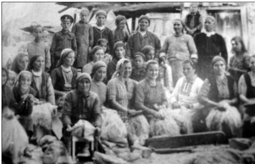
Снимка 2. Обработване на лен на прав дарак и „дързане”, около 1944 г.